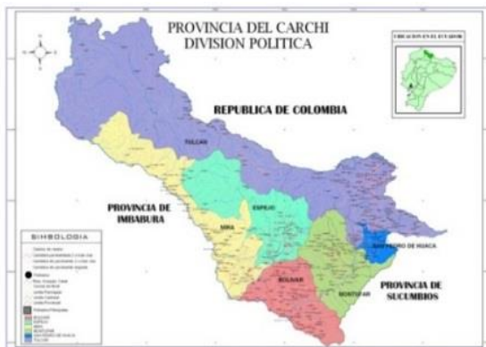
Mapa 1. Mapa del Cantón Espejo